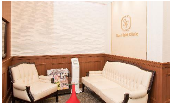
Sun Field Clinic院内环境